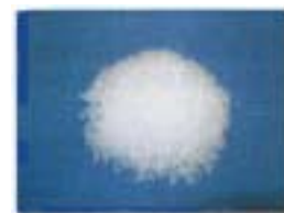
【ナノハイブリッドカプセル2(NHC2)】

上記と の効果を合わせ、従来型のショッピングバッグと比較して燃焼時に約60%の二酸化炭素排出量を削減します。