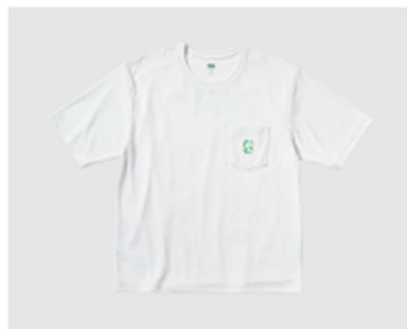
ドラえもん サステナモード クルーネックTシャツ(半袖) 1,500円 (税込み)