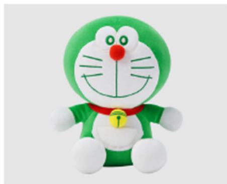
ドラえもん サステナモード トイ(ぬいぐるみ) 1,990円 (税込み)