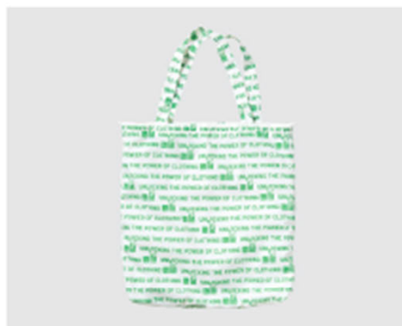
ドラえもん サステナモード ポケットブルバッグ 990円 (税込み)