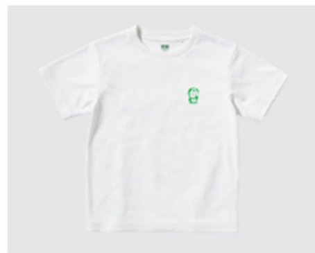
ドラえもん サステナモード KIDSクルーネックTシャツ(半袖) 990円 (税込み)