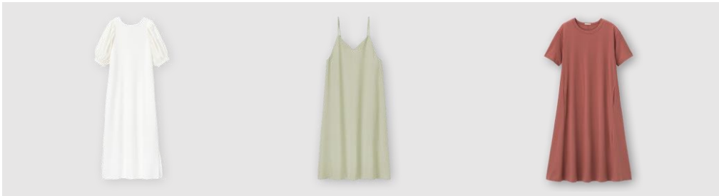
フhakコンビワンピース