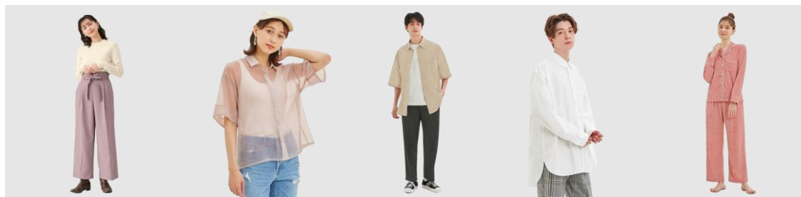
ベルトタックストレート パンツ 1,990円