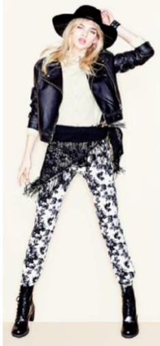
“New Romantic Cowboy” (1月発売)

毎月、新しいファッションテーマを塊で投入し、旬のトレンドファッションを世界観、スタイル感を訴求