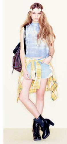
“Grunge Fairy” (3月より発売)