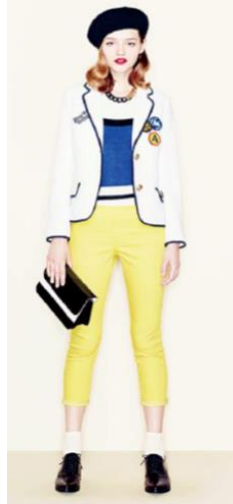
“Parisian Marine” (2月発売)