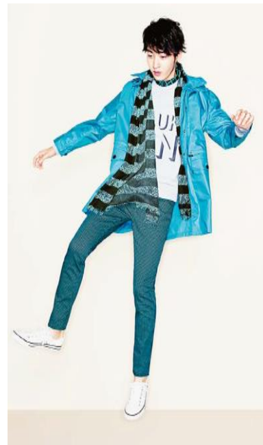
モードカジュアルスタイル