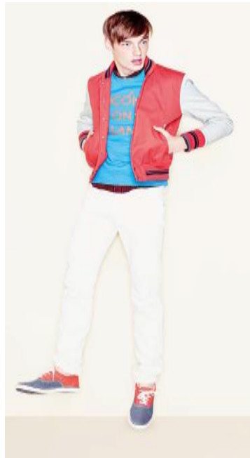
トラッドカジュアルスタイル