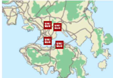
<香港 既存店の分布>