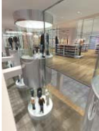
CG:RAGAR/TOZAWA DESIGN RENDERING