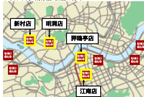
<ソウル市内 既存店・新店の分布>

ソウル・明洞に700坪の大型店オープン (2007年12月) 同時期に、ソウル市内に集中して、追加 3店舗をオープン ソウルでの一層の認知向上、ブランド構築