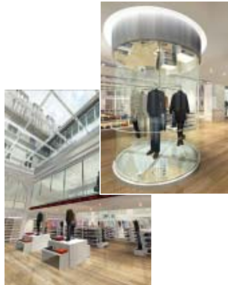
CG:RAGAR/TOZAWA DESIGN RENDERING