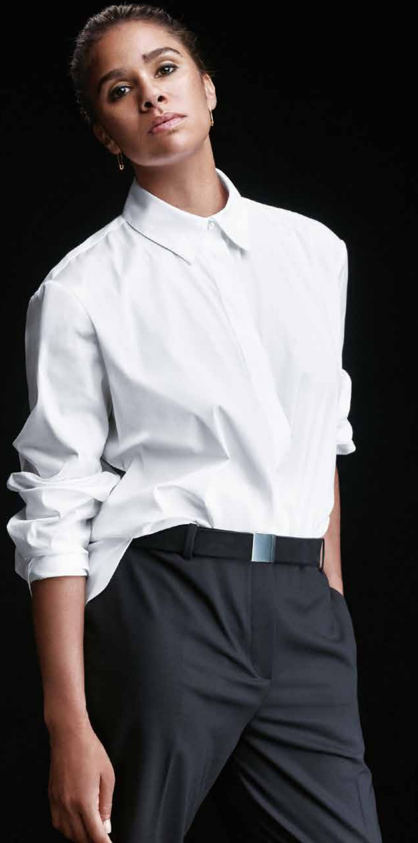
Misty Copeland Ballerina, Philanthropist