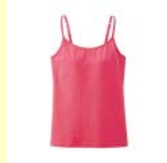
ブラキャミソール

アイテム数 昨年:11型 今年:20型 カラー展開 昨年:1~7色 今年:2~14色