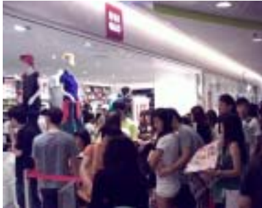
ユニクロ タンパニース ワン店 4月下旬撮影

日本のカジュアルブランドとしての高い認知度 品質と価格のバランスに敏感なお客様からユニクロの定番商品が支持を得られた インパクトの強い新聞広告によりUT、デニムなどのキャンペーン商品を訴求 デザイン性の高いポロシャツやキャミソールなども好調