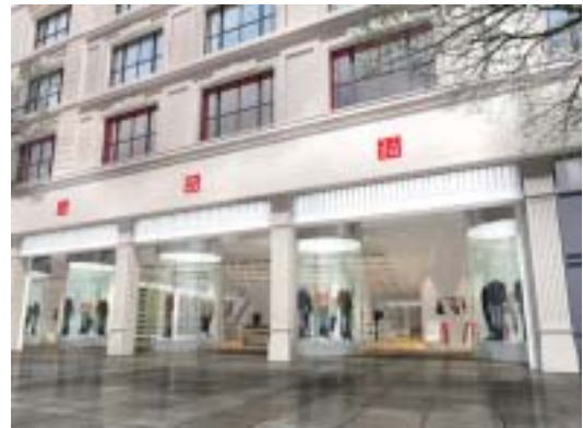
CG:RAGAR/TOZAWA DESIGN RENDERING

グローバル旗艦店「311 オックスフォードストリート店」がいよいよロンドンにオープンいたします。場所は、世界一のショッピングエリアと言われるロンドン オックスフォードストリート。2001年の英国初出店から6年、満を持してロンドンにグローバル旗艦店がオープンです。この店舗は昨年オープンしたユニクロ ソーホー ニューヨーク店に続く2店舗目のグローバル旗艦店となります。