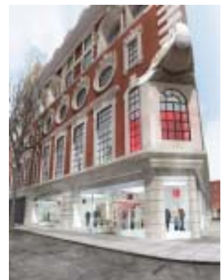
CG:RAGAR/TOZAWA DESIGN RENDERING

世界一のショッピングエリアと言われるオックスフォードストリートの話題を独占すべく、同日、同ストリートに400坪の新規大型店「170 オックスフォードストリート店」もオープンします。窓が多く、自然光が入るようにデザインされた店内には「311 オックスフォード店」と連動した、四角型マネキンボックスが配置されディスプレイがボックス内を回転します。デニムがゆったりと選べるよう、くつろぎの空間を演出したデニムラウンジがロンドン初登場です。