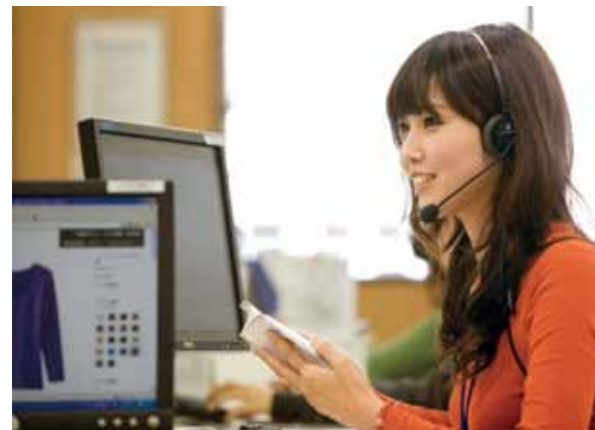
ファーストリテイリングのコールセンター

頂いたご意見は、CS推進部が取りまとめ、速やかに関連部署や経営に報告するとともに、回答が必要なものは、迅速にお答えする仕組みを整えています。